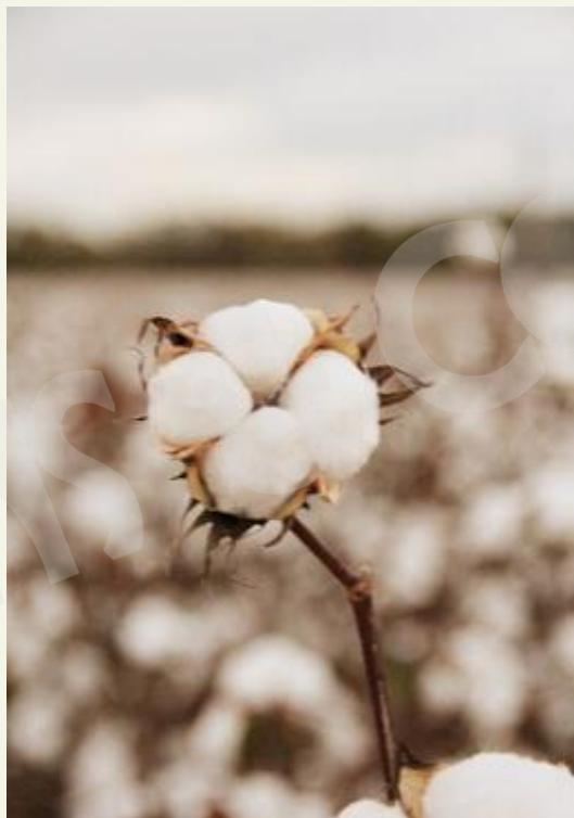
保护种植棉花的农民