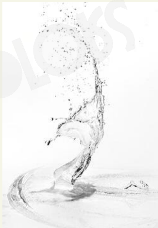
避免土壤侵蚀 保护水资源

每年都有超过百万吨的土壤受到侵蚀和破坏，尤其是农业用地。有机耕种方式可以减少土壤遭受侵蚀和破坏，同时减少农药污染水资源